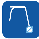
Renkaiden halkaisija ▼ 200 x 35 mm