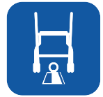
Tuotteen paino* ▼ M 5,9 / L 6,2 kg (+ etukori 340 g)

Valmistaja: Rehasense Sp.z o.o. Sulejowska 45 97-300 Piotrków Trybunalski Poland www.rehasense.com