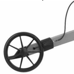
Puhkeamattomat renkaat TPE-materiaalia 200 x 35 mm