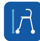
Kokonaiskorkeus ▼ L 74-102 cm M 66-86 cm