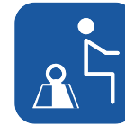
Max.käyttäjäpaino ▼ 150 kg