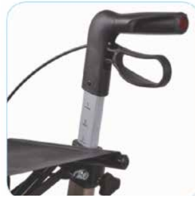
Korkeussäädettävät kahvat M 66-86 cm L 74-102 cm