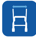
Käsitukien väliin jäävä tila 47 cm Istuimen leveys 42 cm