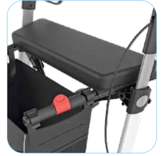
UUTTA: Kova istuin lisävarusteena