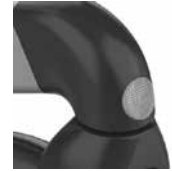
Uutta: Heijastimet myös etuhaarukoissa