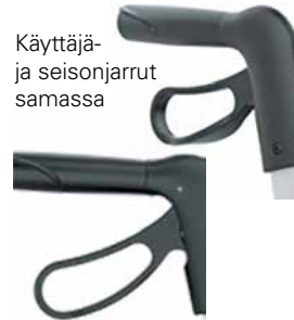
Käyttäjä- ja seisonjarrut samassa