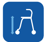
Istuinkorkeus ▼ L 62 cm / M 53 cm Kova istuin L 63 cm / M 54 cm