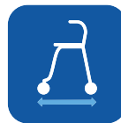
Pituus ▼ 66 cm