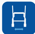
Leveys renkaiden välissä ▼