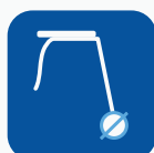
Renkaiden halkaisija ▼