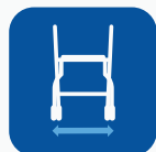
Kokonaisleveys renkaista mitattuna ▼

Lisätietoja tuotteesta suomeksi, mukaan lukien tuotteen käyttöohjeet, www.campmobility.fi verkkosivustolla.