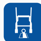
Tuotteen paino* ▼