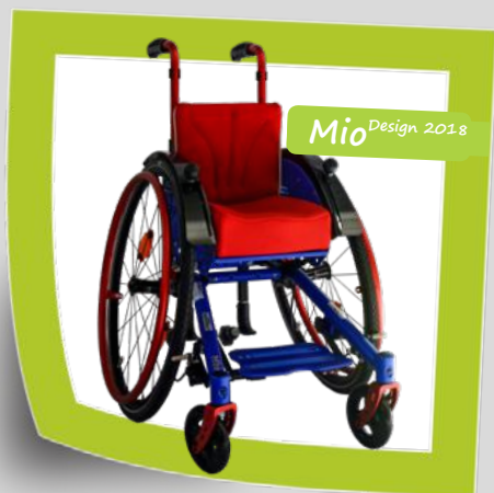
Kevyt ja ketterä aktiivituoli