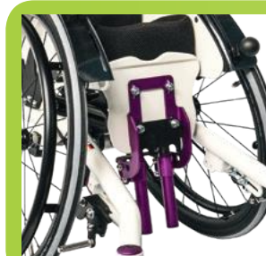
Taakse taittavat jalkatuet