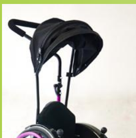
Kuomun sivuosiin integroidut avustajan jarrut