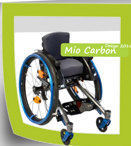
Extra kevyt aktiivituoli