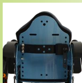
Selkäosalevy ilman selkäosan putkia