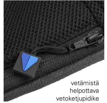
vetämistä helpottava vetoketjupidike

100% hengittävät ja pestävät O2 päälliset O2 istuintyyntä saatavana esim.vakio-, inko- tai ComfAir -päällisillä tarpeesta riippuen.