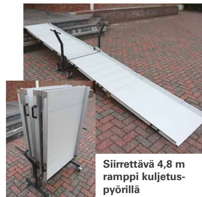
Siirrettävä 4,8 m ramppi kuljetus- pyörillä