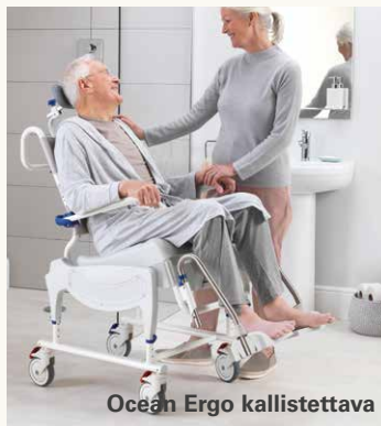
Ocean Ergo kallistettava