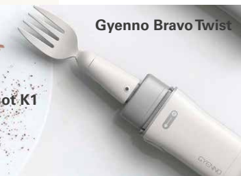
Gyenno Bravo Twist