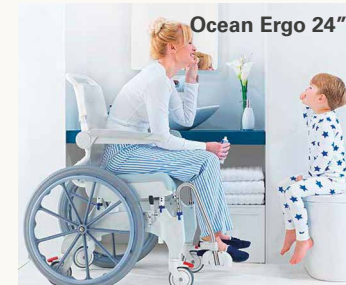
Ocean Ergo 24"