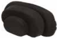
Ellipse pad: 3 kokoa