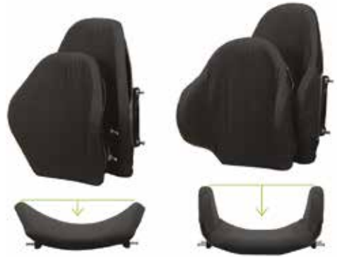
▲ E2 Back E2 Standard - 8cm Contour