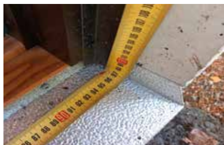
Kartoituskäynti + Kustannusarvio