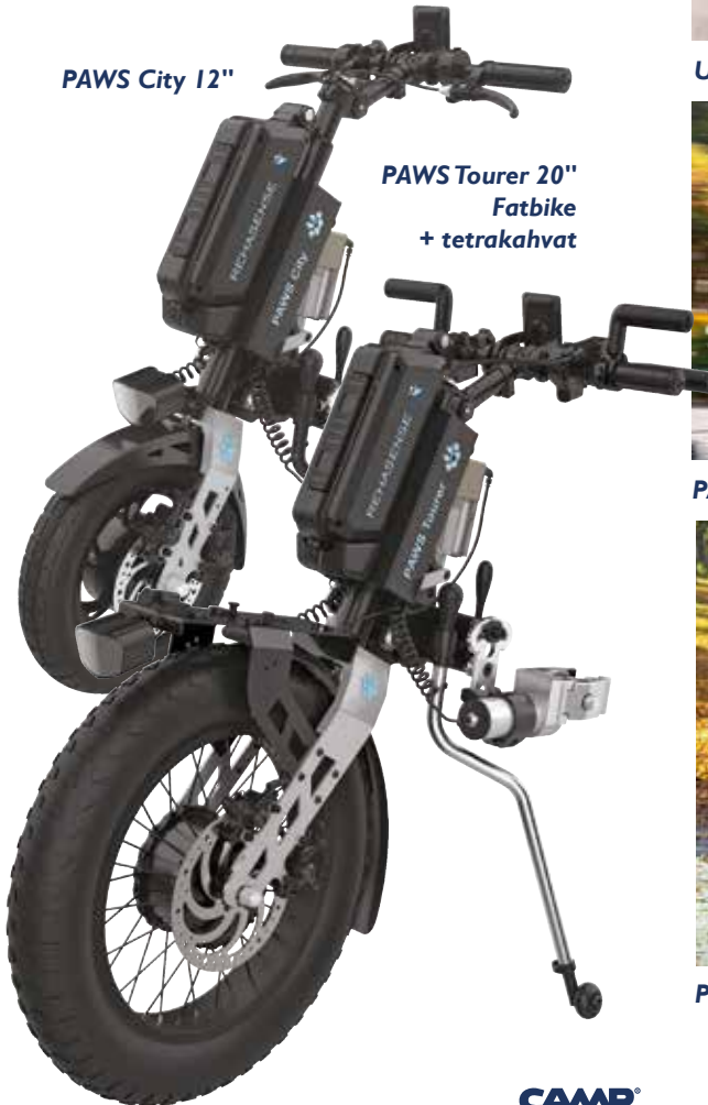
PAWS Tourer 20" Fatbike + tetrakahvat