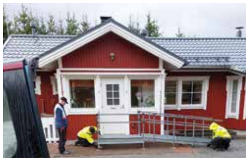
Toimitus + Asennus