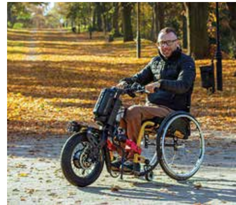
PAWS Tourer 20" + Icon 60