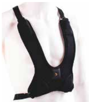
4-PISTE YLÄVARTALOYVÖ MIESTEN JA NAISTEN MALLI