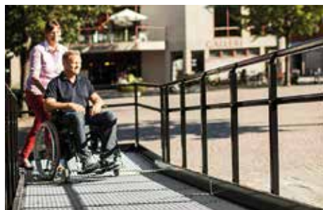
Käytönopastus + Huolto