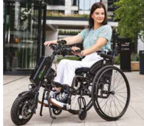
Uutta! Eco Assist + Icon 30 FAF