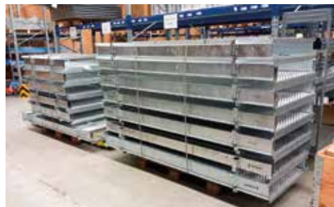
Varastointi ja uudelleenkäyttö