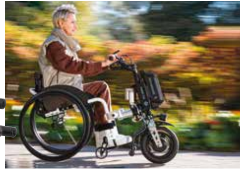
PAWS City 12" + Icon 30