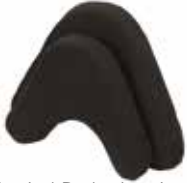
Occital Pad takaraivotuki: 2 kokoa