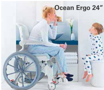
Ocean Ergo 24"