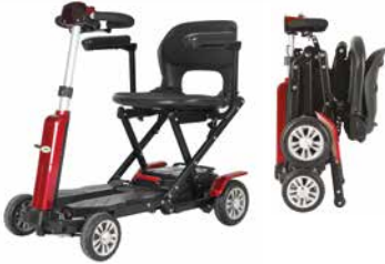
JBH kokoontaitettava mopo