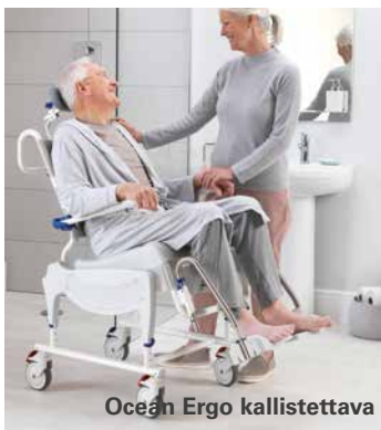
Ocean Ergo kallistettava