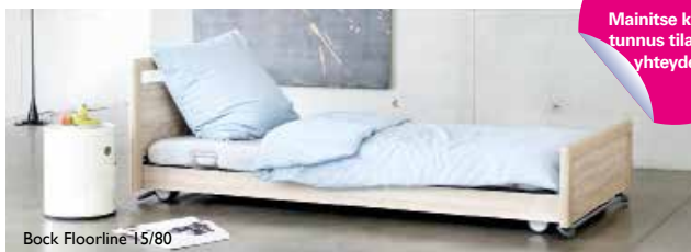
Bock Floorline 15/80