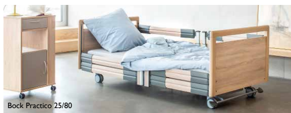
Bock Practico 25/80

Mainitse kampanja- tunnus tilauksen yhteydessä!