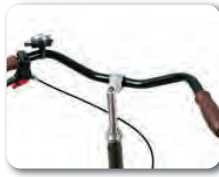
S3 - City ohjaustanko