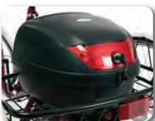
E5 - Lukittava takaboksi tilavuus: 30 litraa