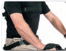
P3 - Lantio- ja selkätuki