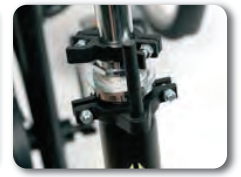
D1 - Ohjauskulman rajoitin