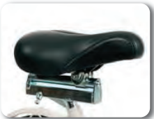
P4 - Säädettävä satula (140 mm)