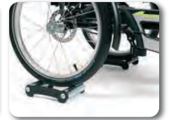
O7 - 7 vaihteinen