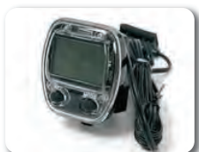
E3 - Matkamittari (sis. patterit)