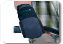
E11 - Käsituki "hanskamalli"