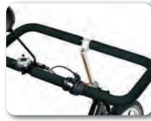
S4 - Suorakulmainen ohjaustanko