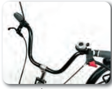
S1 - Classic ohjaustanko