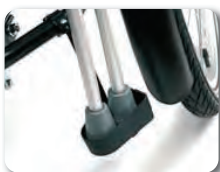
E6 - Keppiteline