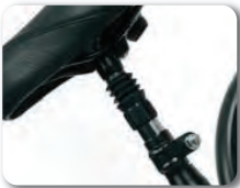
P5 - Satulaputki iskunvaimentimella