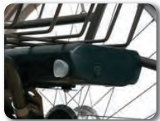
BAT 9 - BAT 13 - Extra akut E-bike (9A tai 13A)