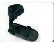
F4 - Jalkatuki tarranauhalla & nilkkatuki