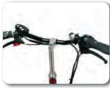
S2 - Suora ohjaustanko