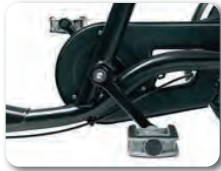
O1 + B1 - Vapaa napa