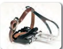
F2 - Polkimet, joissa varvaspidike ja hihna