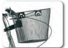
E14 - Etukori