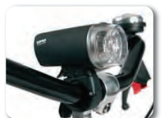
E2 - Valot (sis. patterit)