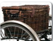
E4 - Vintage kori