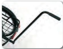
E1 - Työntökahva (335 mm tai 605 mm)