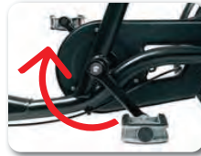
O2 - Jalkajarru