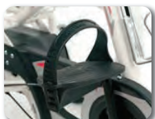
F1 - Polkimet remmillä