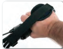
E9 - Käsihinnat