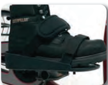
F3 - Jalkatuki tarranauhalla