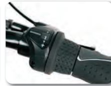
O3 - 3 vaihteinen