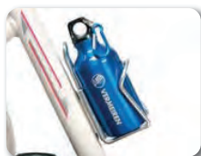
E7 - Juomapulloteline (ei sis. pulloa)