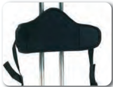
P1 - Lantiotuki