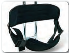
P2 - Selkätuki