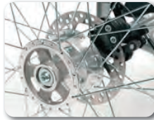
B1 - Levyjarrut takapyöriin