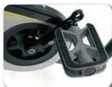
F5 - Polkimet säädettävällä pituudella (22 mm)