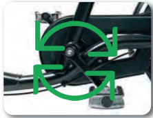
O6 - Kiinteä napa