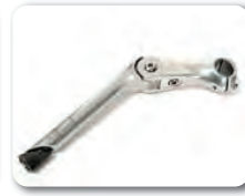
S5 - Ohjaustangon säätöadapteri (-10° +50°)