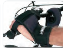
E10 - Käsituki hinnalla